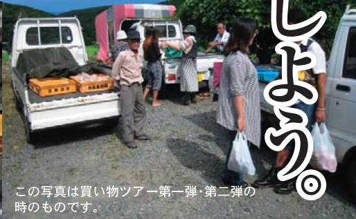
この写真は買い物ツアー第一弾・第二弾の時のものです。